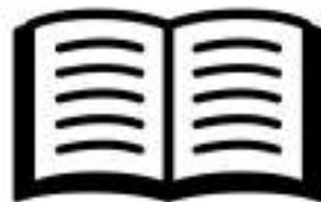
トークスクリプト